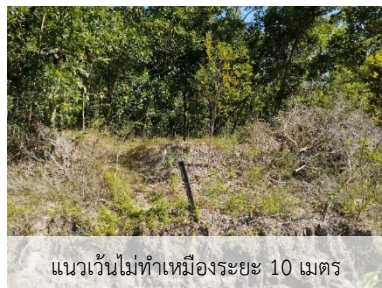
แนวเวนไม่ทำเหมืองระยะ 10 เมตร