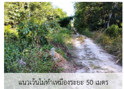
แนวเวนไม่ทำเหมืองระยะ 50 เมตร